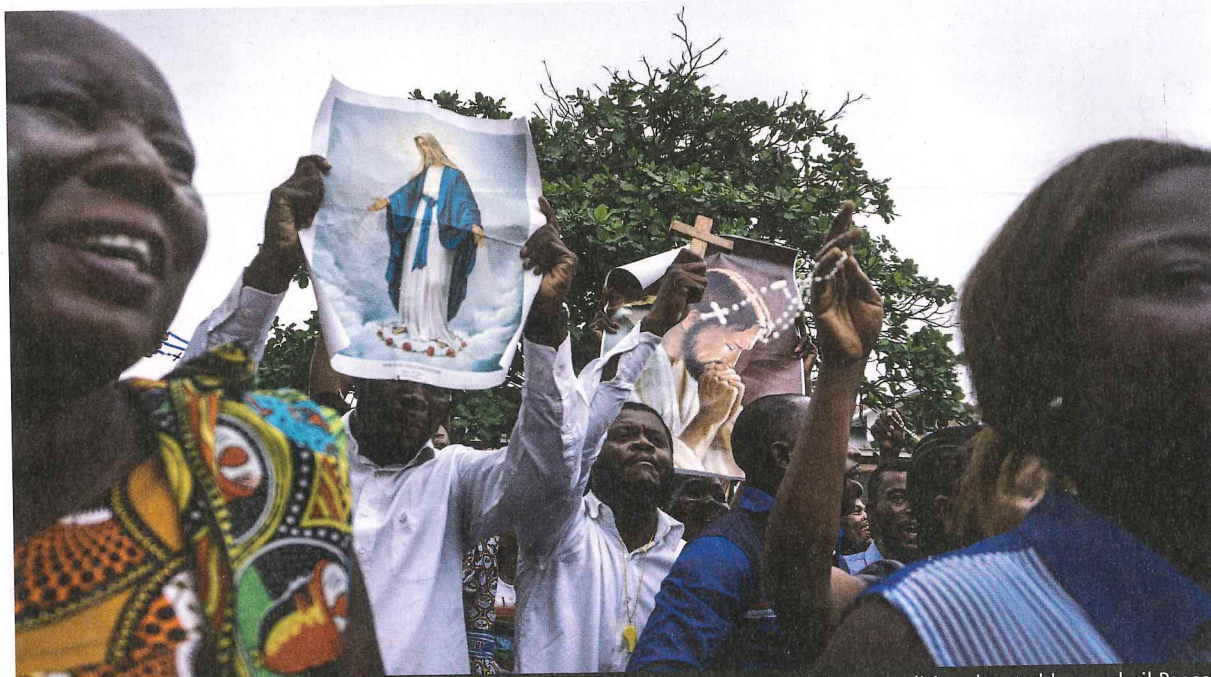
Alcuni manifestanti cattolici nelle strade di Kinshasa protestano per il trascinarsi della crisi politica che sta bloccando il Paese

Il Comitato laico di coordinamento dei cattolici si è ormai imposto sulla scena sociale e politica della R. D. Congo come il principale movimento di opposizione al regime. E proprio per questo ha ricevuto la sua dose di minacce e insulti: «Un movimento anarchico di stampo cristiano, che sotto una copertura angelica e di pietà-